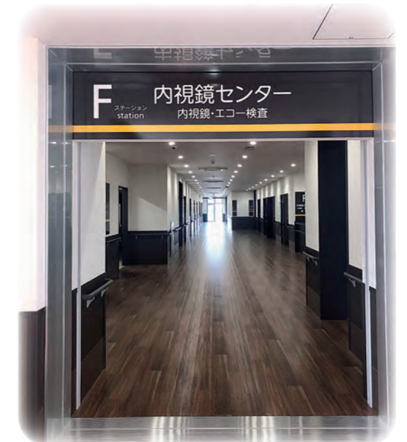
／ 内視鏡センター 入口