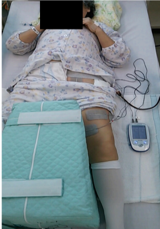
▲当院では手術の場合、翌日から実施しています。

筋力を取り戻すためにリハビリで筋力トレーニングを実施しますが、 電気刺激を併用することで効果的に筋力を回復させることができます！