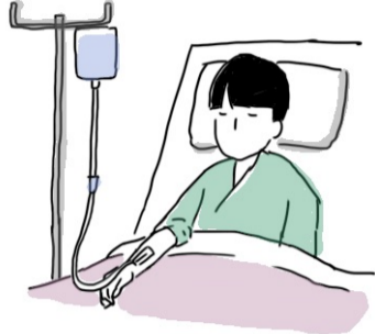
内科疾患による安静の後