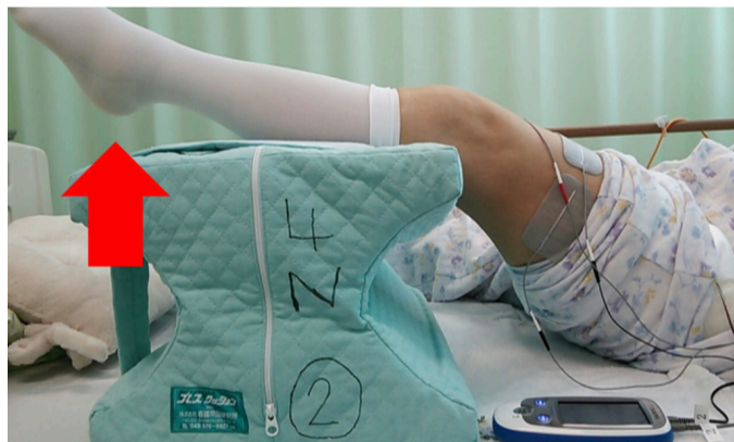
▲電気刺激によって筋肉を動かす補助をします。